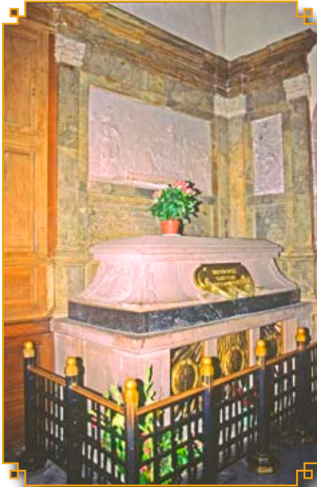
A droite, au mont SAINTE-ODILE, tombeau de la sainte, chapelle richement décorée et les jardins du couvent