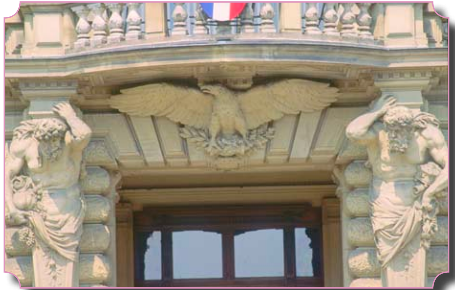
STRASBOURG : ci-dessus, détail de la façade du palais du Rhin ci-dessous, un aspect du théâtre