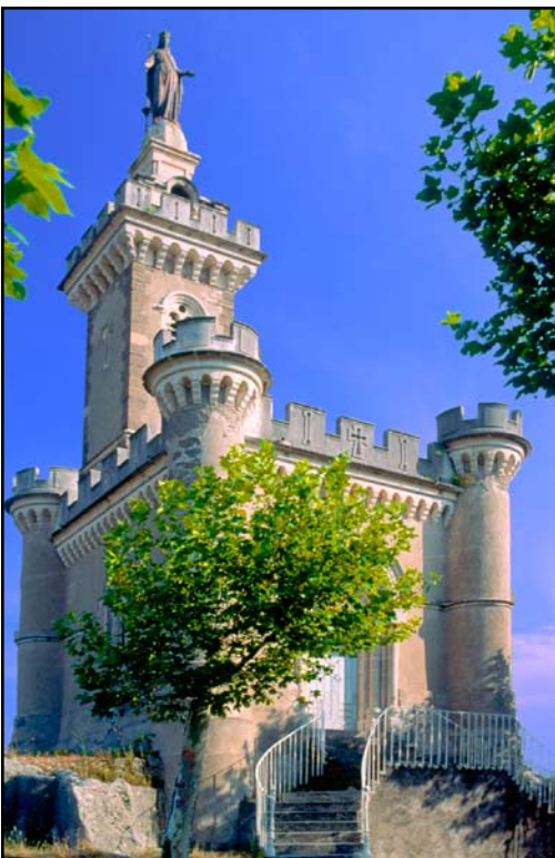
Ci-dessus et à droite : SAINT-AMBROIX : plateau de Dugas, statue de la Vierge et grotte

Cliquez sur le lien pour plus d'informations