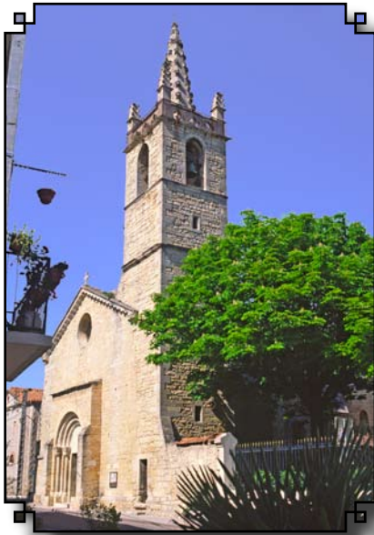
Ci-dessus : église de BERNIS

alt. 220 m, commune du Gard (P 28 s/carte de l'arr.). Arr. de Nîmes, canton de Lussan. 210 hab., les Belvézetiens (iennes) ; sup. 2286 ha. Ruines féodales (Castellas). Église du 19 e s.