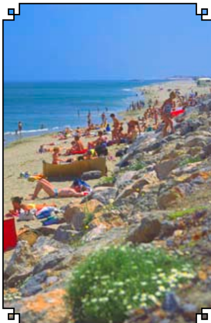
Ci-dessus, LEUCATE, plage

Autorail (train touristique) du Minervois. Cinéma. Gymnases. Piscine. Pêche. Randonnées pédestres. Spéléologie. Sports aériens, nautiques et de rivière. Stades. Tennis. VTT (pinède). Camping-caravaning. Gîtes ruraux.