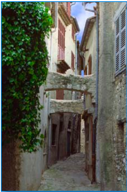
Ci-dessus, ruelle de SAINT-PAUL-DE-VENTE; à droite, site de SAINT-SAUVEUR-SUR-TINÉE

Culture et artisanat. Fondation Maeght, musée d'Art contemporain (Chagall, Matisse, Miro) avec jardin de sculptures (visites toute l'année). Musée Municipal (expos temporaires d'artistes contemporains).